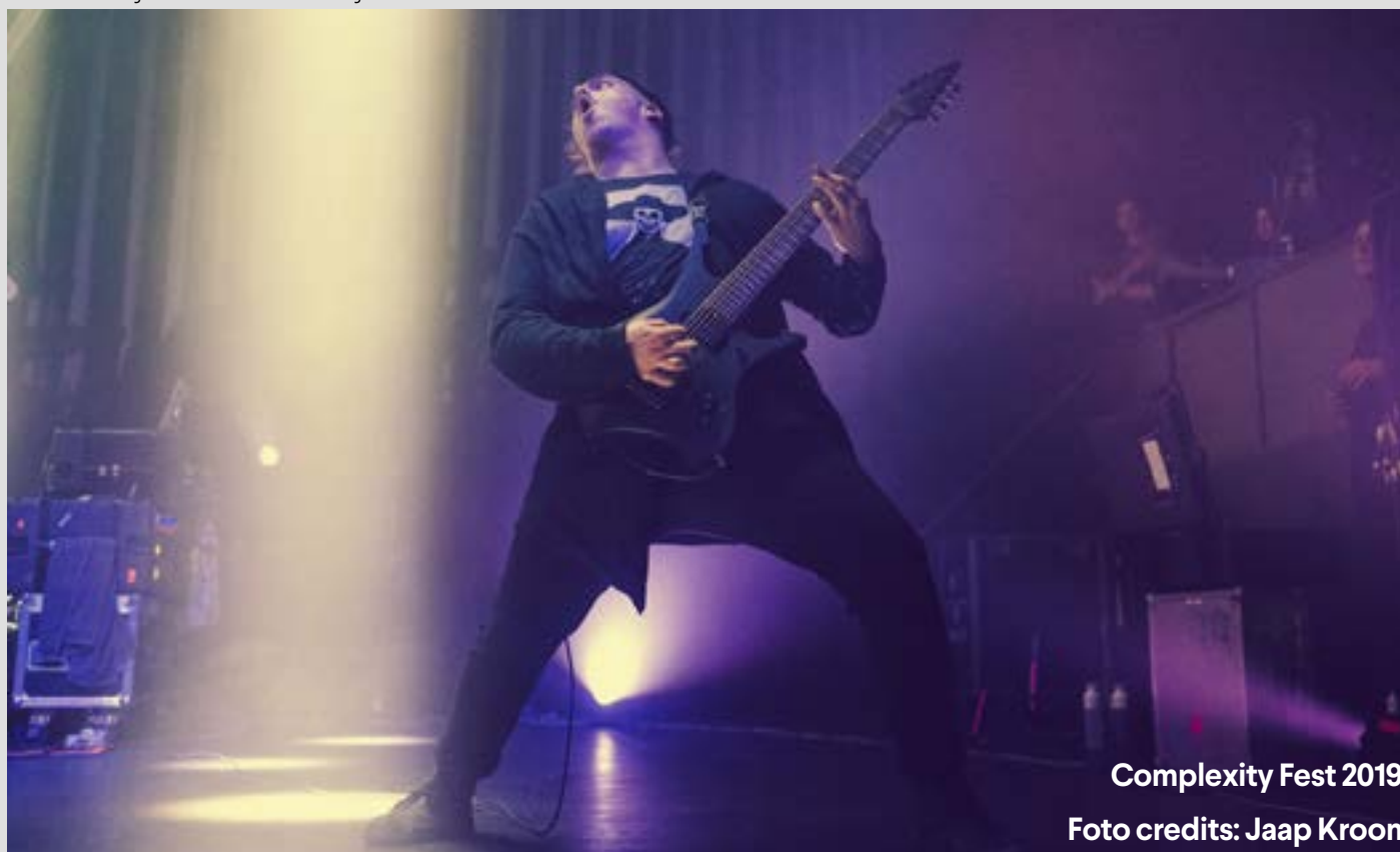
Complexity Fest 2019

Stadsbreed blijft Patronaat investeren in het popklimaat waarbij het niet louter gaat om grote namen binnenhalen, maar ook ruimte geven aan lokale artiesten met een directe achterban in de stad. Om het draagvlak onder jongeren binnen, maar vooral ook buiten het centrum van Haarlem te vergroten, werkt Patronaat samen met verschillende organisaties. Om duidelijk herkenbaar te zijn als belangrijke speler in het uitgaanscircuit wordt een nieuwe invulling gegeven aan de nachtprogrammering. Een nieuw clubhuis